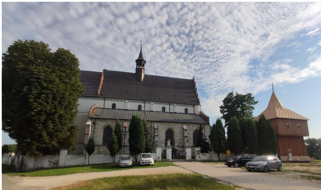
Ilustracja 4: Zespół klasztorny paulinów w Beszowej

później na kaplicę Aniołów), jako osobny budynek - dawna sala opacka, dawny refektarz i nieistniejące już przejście arkadowe prowadzące do kapitułarza.