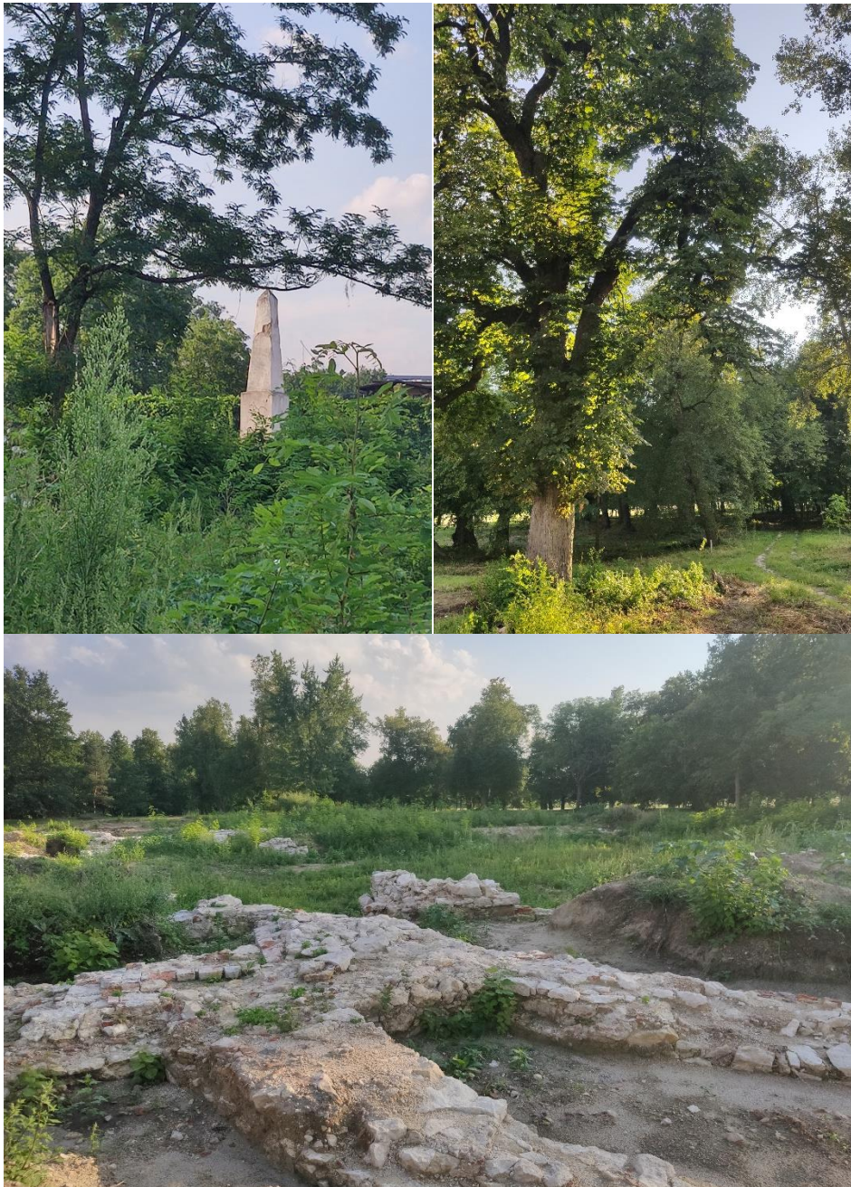
Ilustracja 12: Pozostałości zespołu pałacowego w Łubnicach: fundamenty pałacu, park pałacowy, zdjęcia autorstwa BC Consulting Bożena Cebula