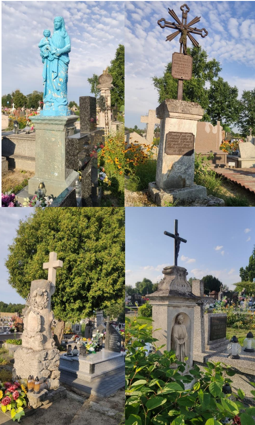
Ilustracja 7: Cmentarz rzymskokatolicki w Beszowej

Drugim istotnym obiektem zabytkowym jest założenie pałacowo-ogrodowe z fundamentami pałacu Radziwiłłów z II połowy XVII w. znajdujące się w miejscowości Łubnice.