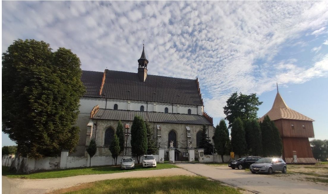
Ilustracja 4: Zespół klasztorny paulinów w Beszowej