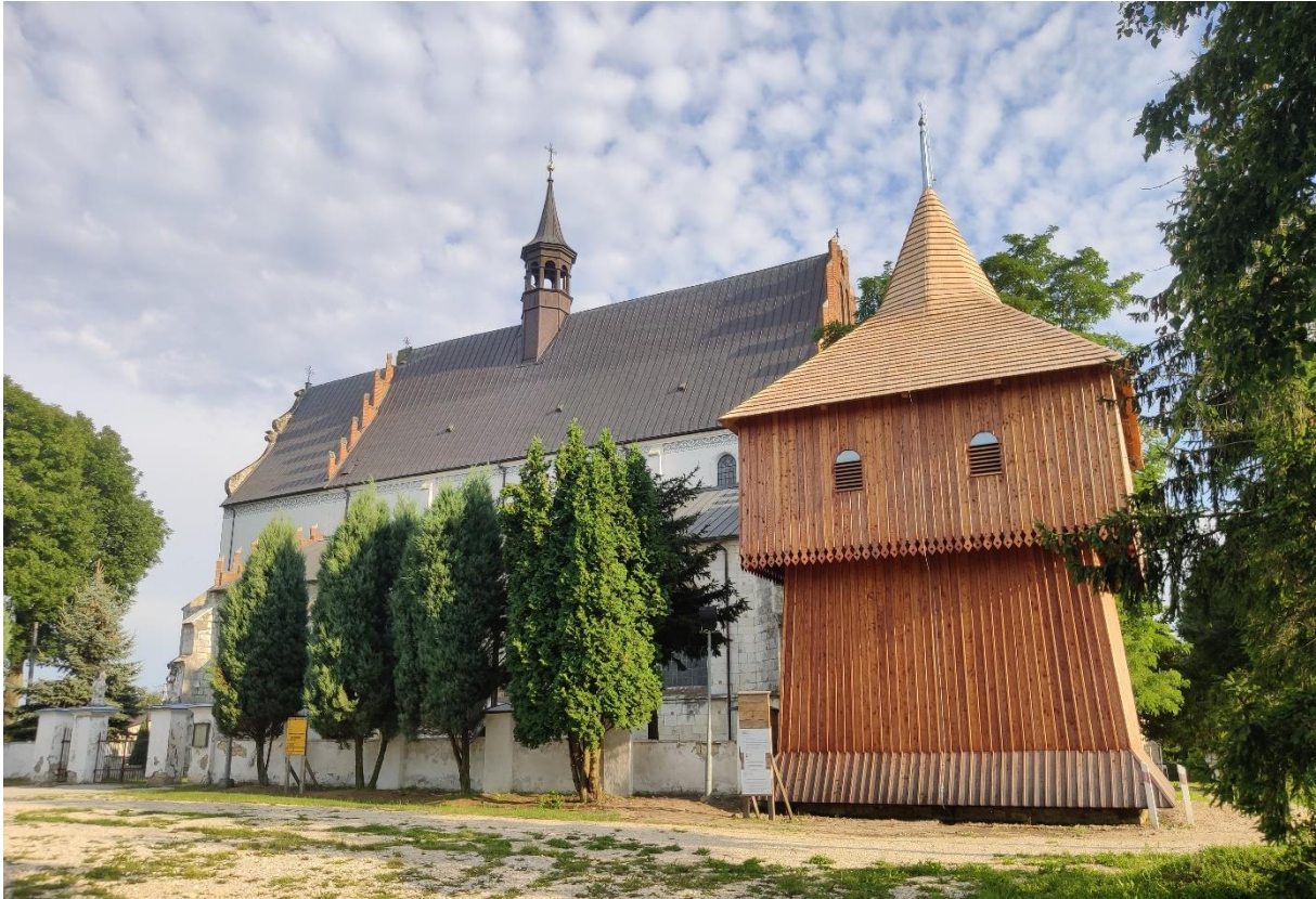
Ilustracja 6: Drewniana dzwonnica w Zespole klasztorным paulinów w Beszowej